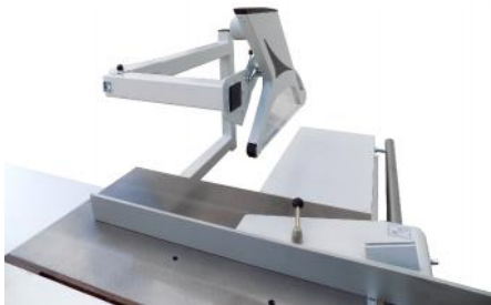
Bras support de cape articulé permettant l'usinage de pièces encombrantes en hauteur