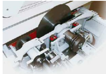
Groupe de sciage et inciseur