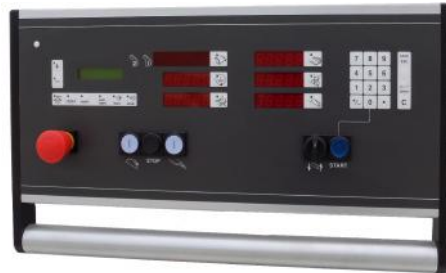
Panneau de commande suspendu avec CN pilotant le guide parallèle, inclinaison de la lame, montée baisse de la lame et réglage fin de l'inciseur sur les 2 axes